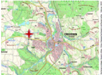
Lage des Baugebietes westlich von Creußen

Das Planungsgebiet und seine Lage sind aus den beigefügten Plänen (Lageplan und Ausschnitt aus dem Vorentwurf maßstablos) ersichtlich.