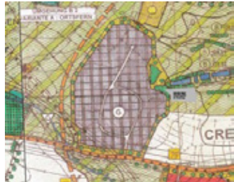
Ausschnitt aus dem rechtswirksamen Flächennutzungsplan

Geltungsbereich des Vorentwurfs in der Fassung vom 26.10.2020 mit redaktionellen Änderungen bis 29.03.2021: Der Aufstellungsbeschluss für den Bebauungsplan wird hiermit gemäß § 2 Abs. 1 Satz 2 BauGB ortsüblich bekannt gemacht.